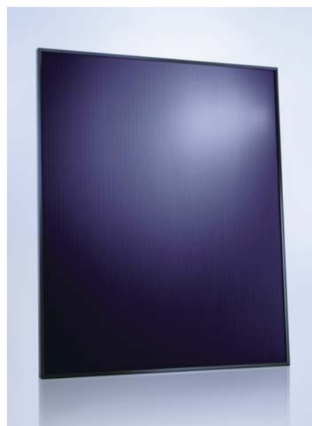
SCHOTT ASI™ 87/90/95/100